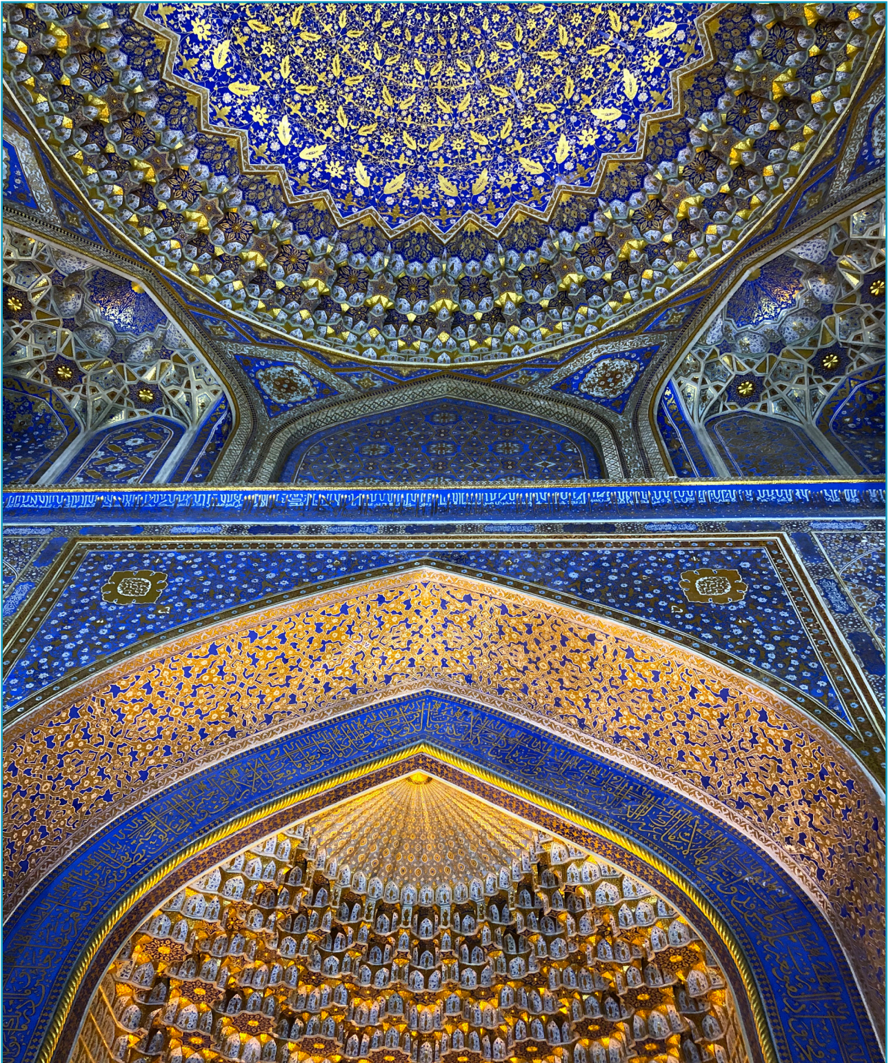
Registan, Interior view (2022).

their city, combining ancient legends, historical facts, and personal reflections. Through their eyes, we can sense the pride and love they feel for their land, as well as an awareness of the crucial role Samarkand played and continues to play in the history of the world. Here, then, are some of their narrations and accounts, vivid testimonies of how Samarkand's past continues to inspire and mould the present and future of this extraordinary city.