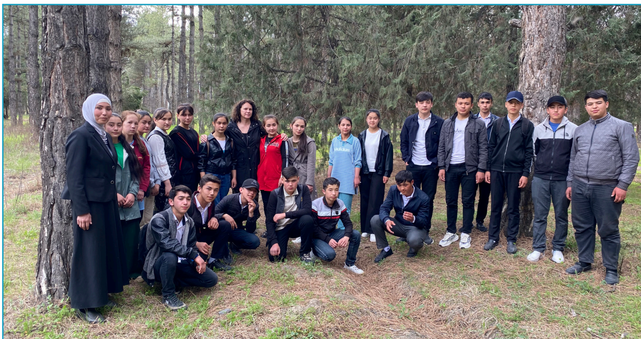
Nayman atrofida guruh surati (2024).

Jildni mashhur matematik Al Kvarazmiy so'zlari bilan ochishni tanlash tasodifiy emas. Bu Nayman 1-maktabning matematika kabineti markaziga ramziy tarzda joylashtirilgan uning tasviri birinchi kundanoq menda paydo bo'lgan chuqur taassurotdan kelib chiqadi. Ushbu portret bilimning fanlararo aloqadorligi muhimligini doimo eslatib turadi va insonning parallel rivojlanishsiz bilim o'zining ichki qiymatini yo'qotishini eslatadi va taraqqiyot xabarchisi bo'lishdan ko'ra, u butun insoniyat uchun potentsial zararli vositaga aylanish xavfini tug'diradi.