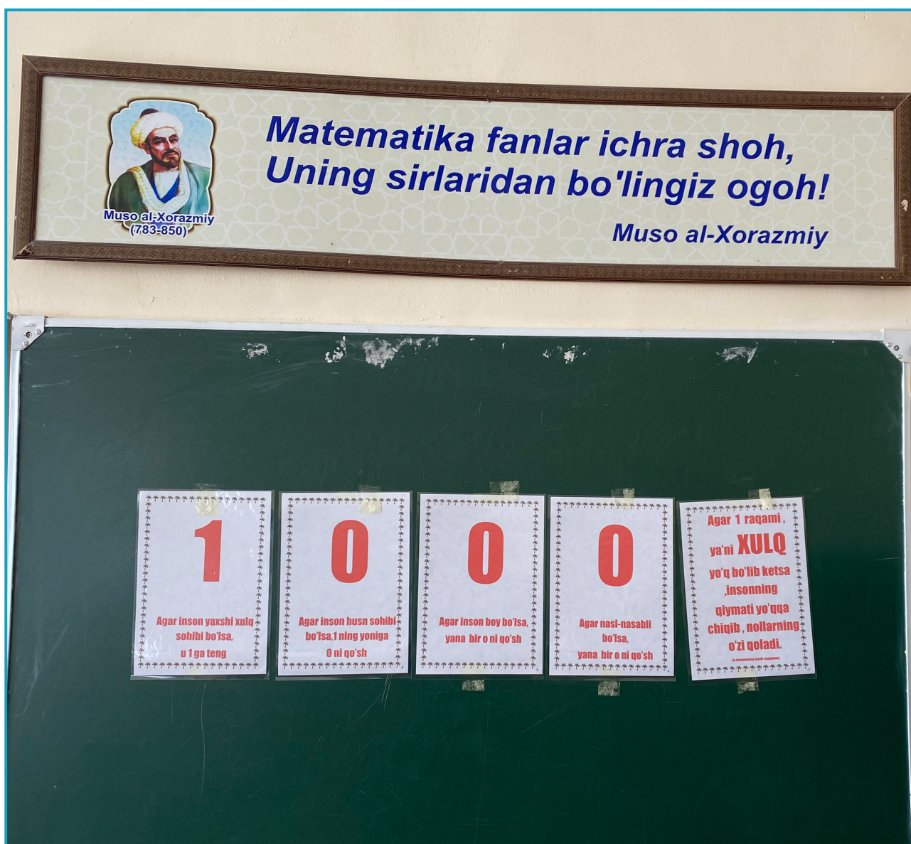
L'aula dell'aula di matematica della Scuola 1 di Nayman (2022).