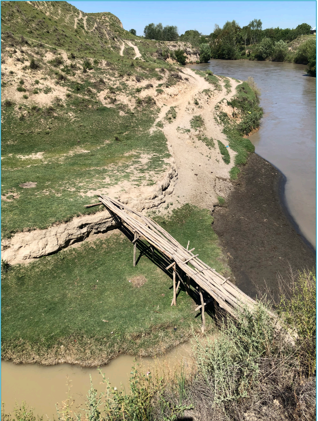
Wooden bridge over the Dargom stream (2023).