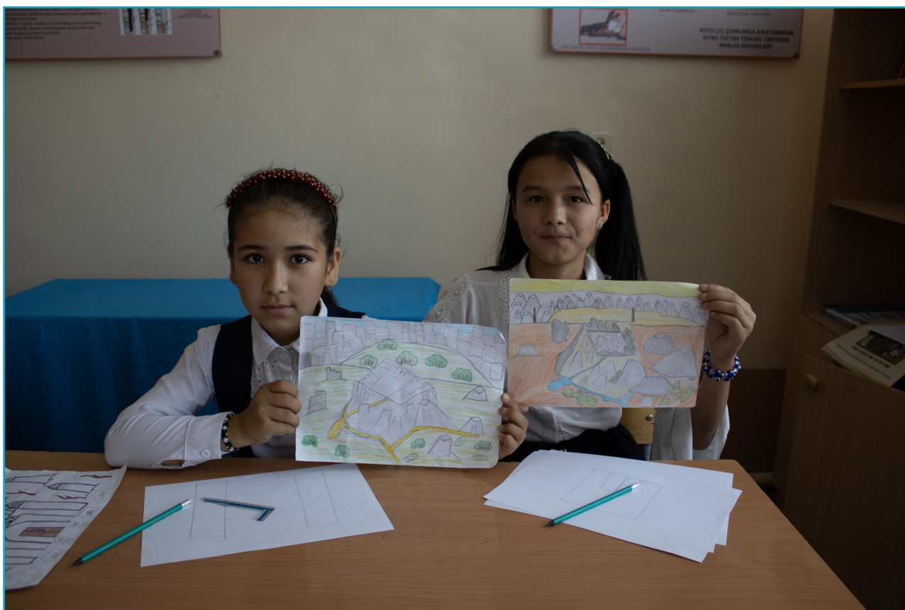
Nayman 1-maktab o'quvchi qizlari tomonidan chizilgan Kafir Qal'a (2023).

Ilhom olish uchun biz Samarqandlik o'g'il-qizlar tomonidan ushbu afsonani vizual talqin qilgan ba'zi rasmlarni to'pladik.