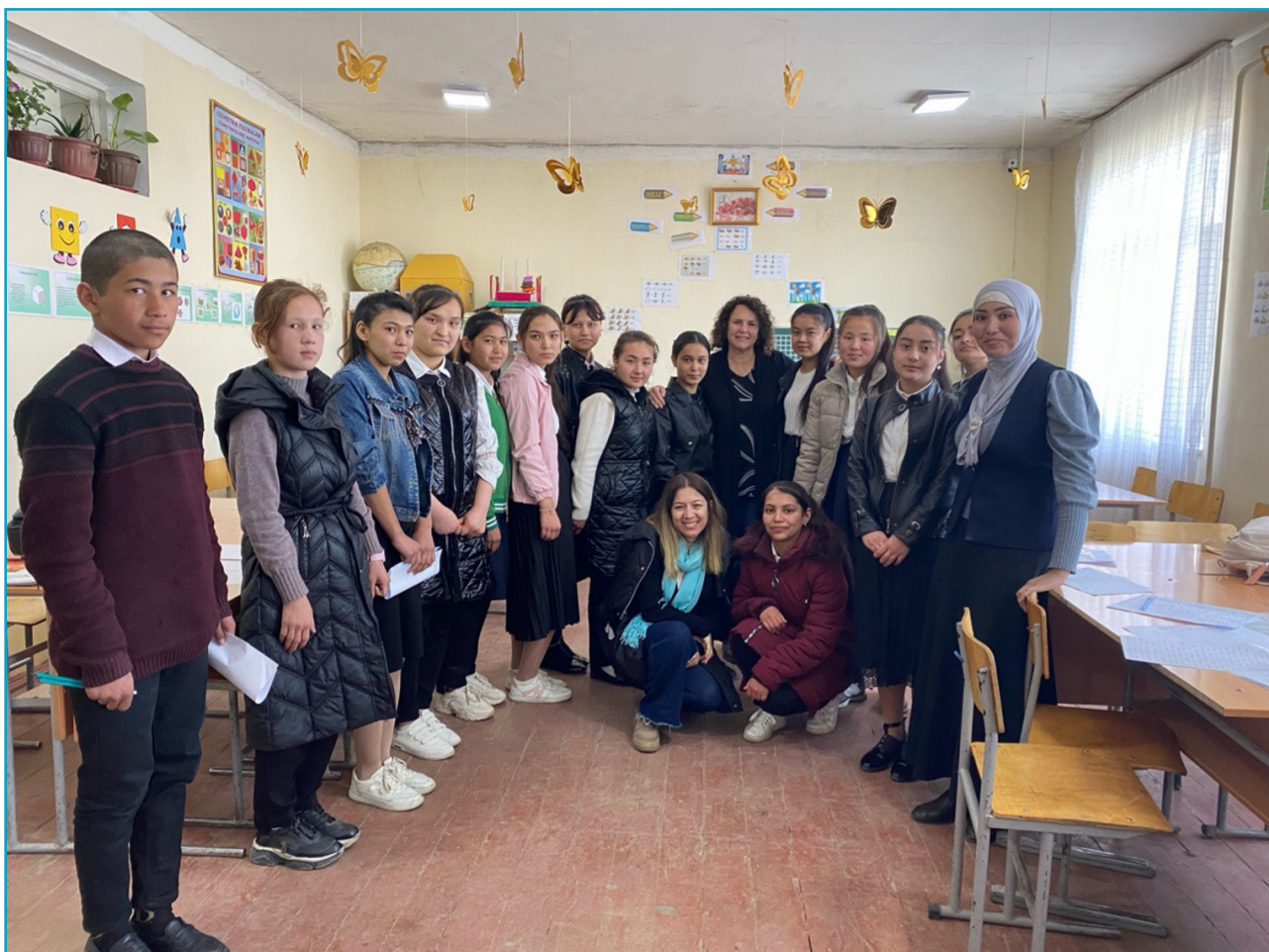
Nayman 1-maktabining sinf xonasida guruh surati (2024).

Samarqand viloyati maktab jamoasining yakuniy tabriklari bilan tanishing!