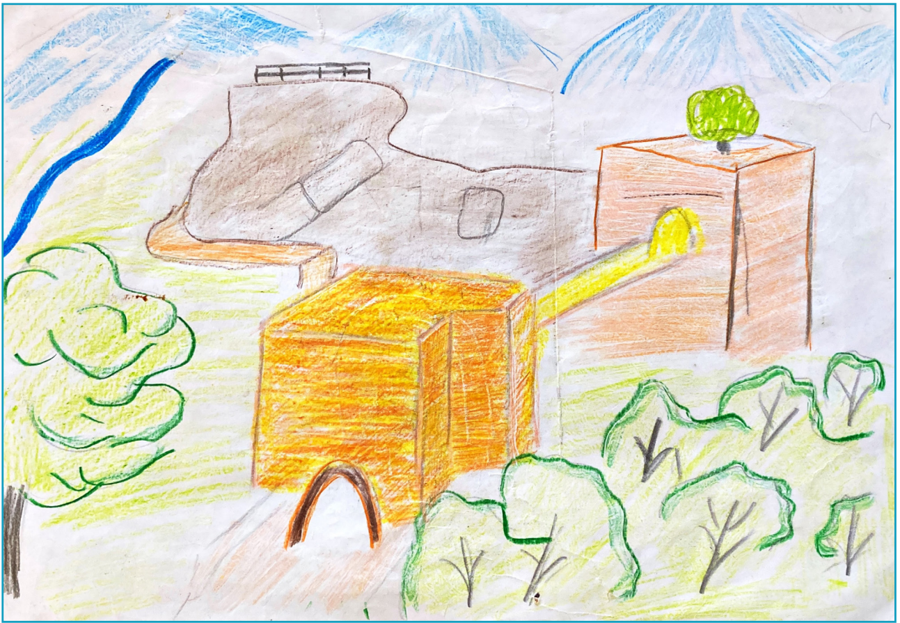
Kafir Qal'a, anonim (2024).