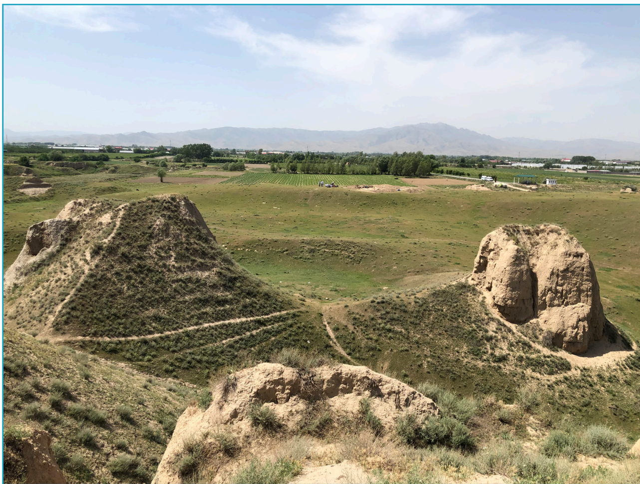
Panorama da Kafir Kala (2022).

Il sito è parte integrante delle comunità locali che lo vivono. In tale prospettiva, il futuro parco archeologico deve essere quindi un elemento di inclusione e condivisione oltretutto di divulgazione e di apertura ad un grande pubblico. Al tempo stesso ci si auspica che possa assumere sempre più un importante ruolo sociale ed economico per le comunità che vivono nella zona e che quotidianamente hanno un rapporto con il sito.