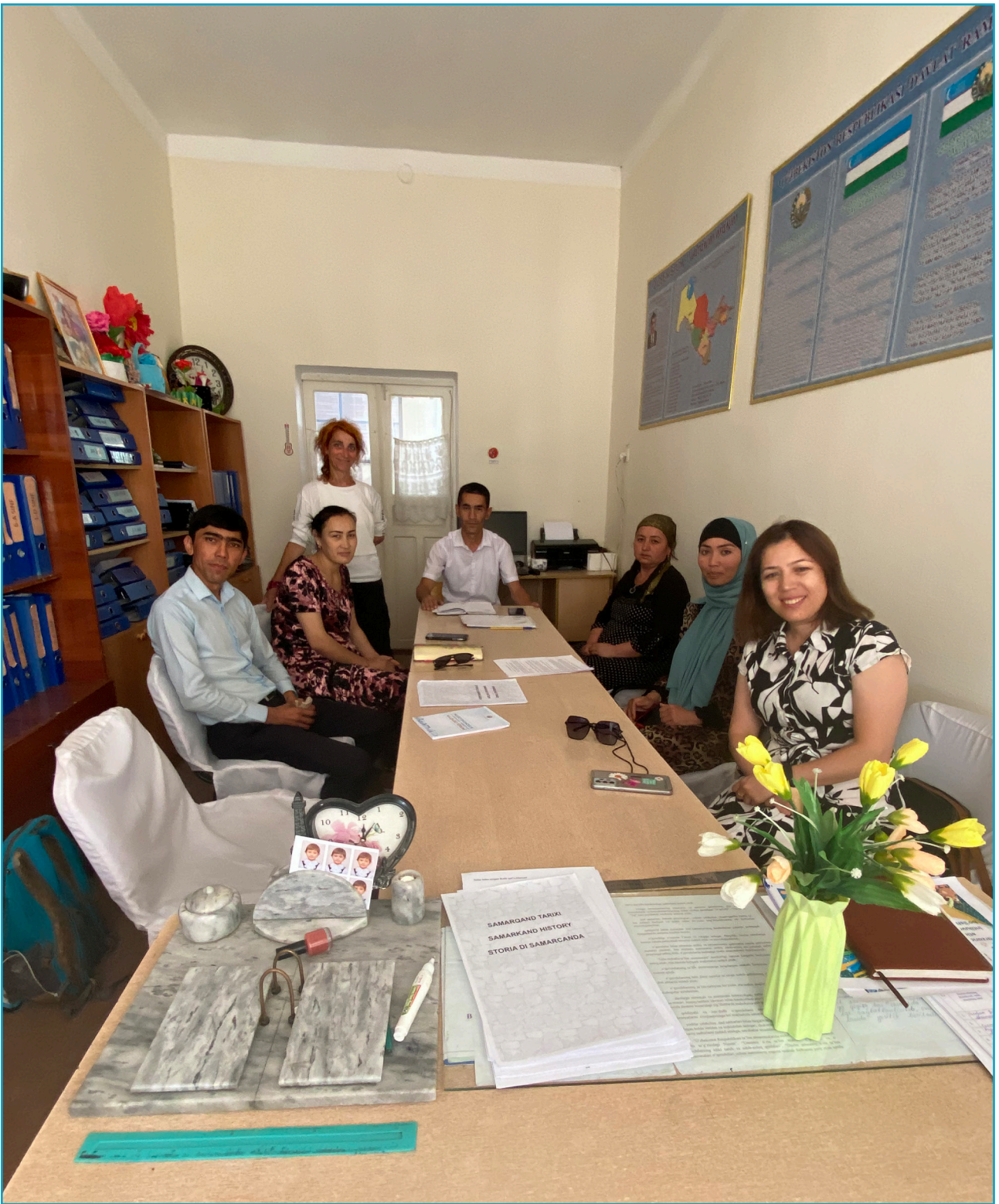
Group of teachers from School 1 at Nayman (2023).

Check out the final greetings from the school staff of Samarkand region!