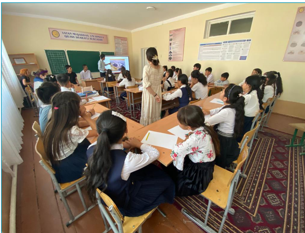
In the classroom during the History lesson, School 1, Nayman (2024).

The choice to open this volume with the words of the renowned mathematician Al-Khwarizmi was not arbitrary. It derives from the deep impression that the portrait of him, emblematically positioned in the middle of the math classroom in Nayman's school 1, made on me from the very first day. This portrait serves as a constant reminder of the importance of the interdisciplinarity of knowledge and reminds us that, without corresponding human growth, knowledge loses its inherent value. Instead of heralding progress, it runs the risk of becoming a potentially dangerous instrument for humanity as a whole.