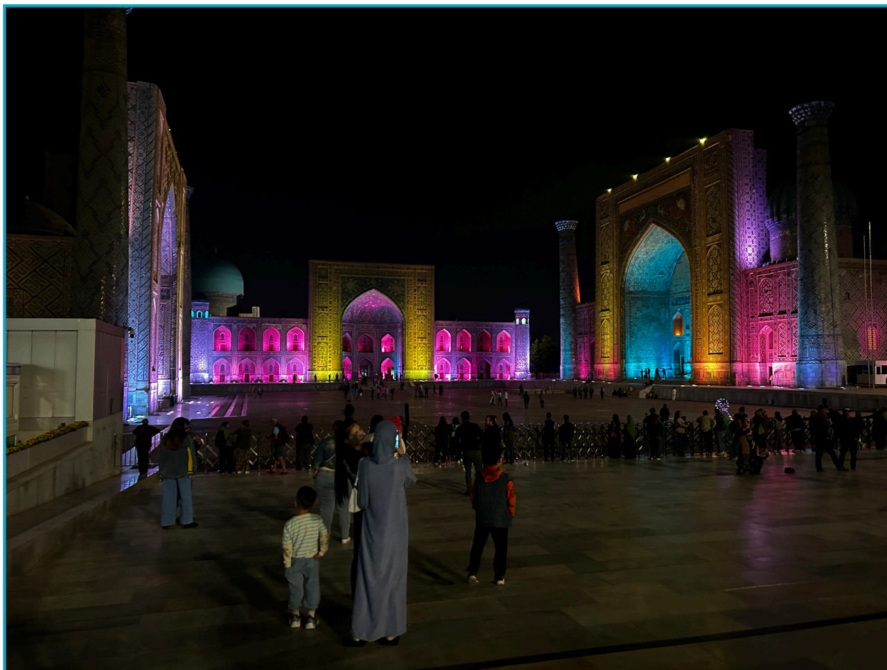
Kechki paytdagi Registon (2024).