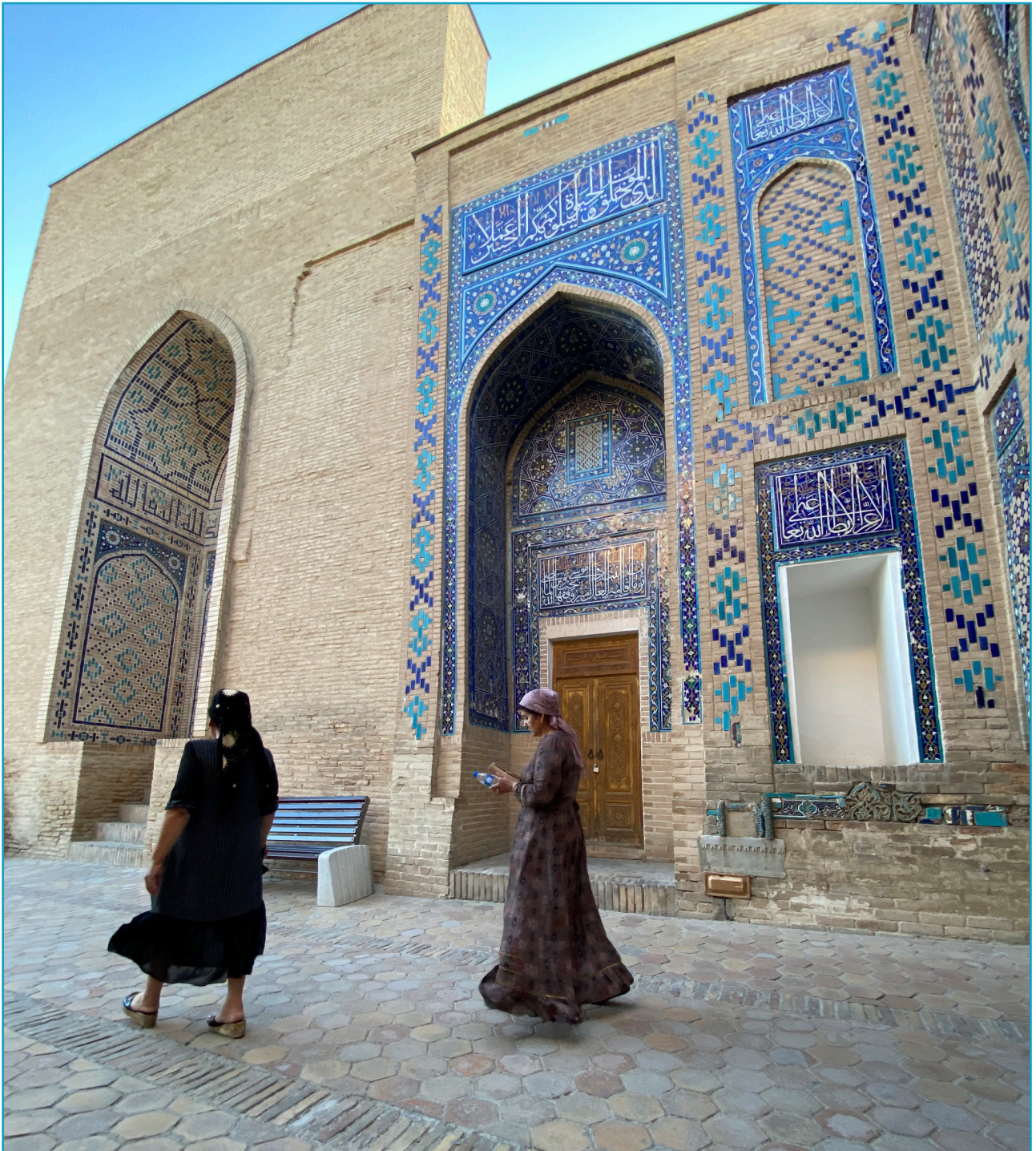
Bibi-Kanyum Mausoleum (2022).

I especially enjoyed hearing about Kafir Kala, a place my grandad told me about when I was only six. It is interesting that this spot has two different names: Kofir