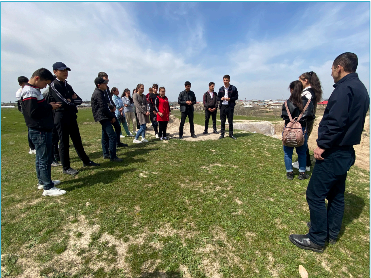
Open-air lesson with the class at Kafir Kala (2024).