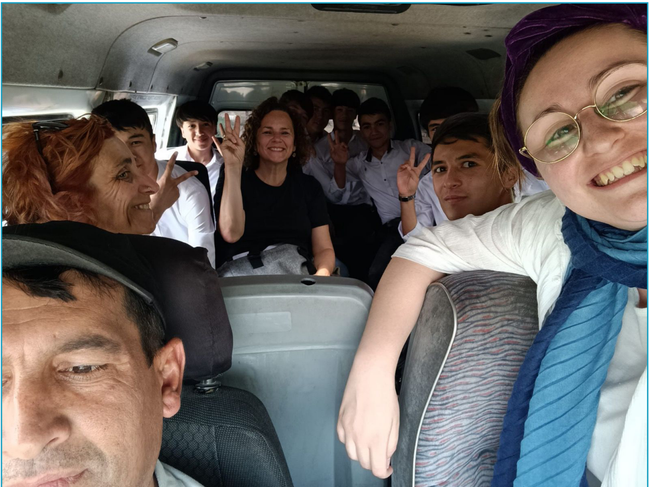
Travelling from school to Kafir Kala (2023).

The king, touched by the wisdom and compassion of his queen, set to work immediately. Having mobilised the kingdom’s resources and after months of hard work and great sacrifice, the canal was completed.