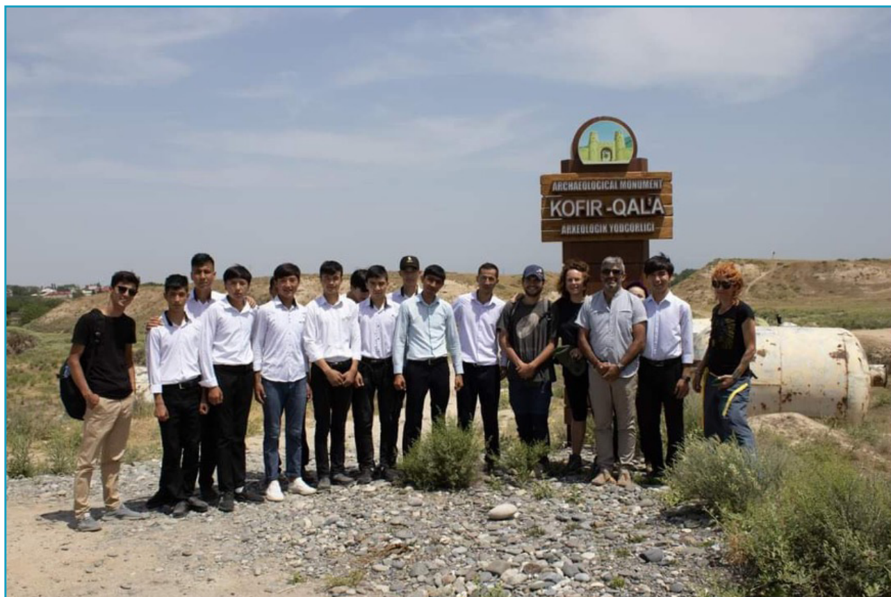
Gruppo di studenti all'ingresso del sito archeologico (2023).

Le interviste ai docenti e le lezioni scolastiche hanno messo in luce il ruolo fondamentale dell'antropologia nel promuovere il coinvolgimento attivo della comunità. Integrando l'archeologia nei programmi educativi, questo approccio ha saputo stimolare la curiosità e il pensiero critico degli studenti, consentendo a tutti noi di iniziare a comprendere meglio i significati